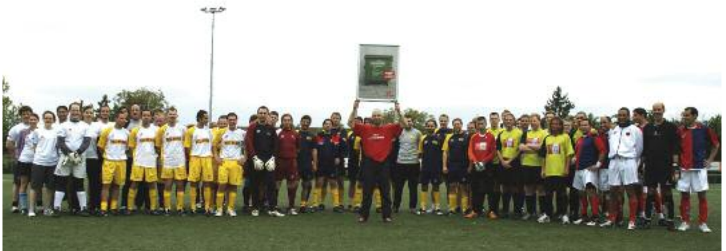
Am 8. Mai kickten acht Mannschaften beim Benefiz-Fussballturnier „Kick & Rock“ zu Gunsten der Wiener Tafel