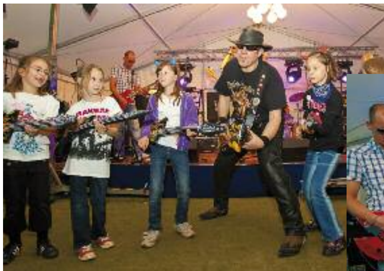
Keine Nachwuchssorgen: Gekonnt zupften die Mädchen ihre Luftgitarren wie Österreichs 1. Luftgitarrenband „Die 3 Extremen“