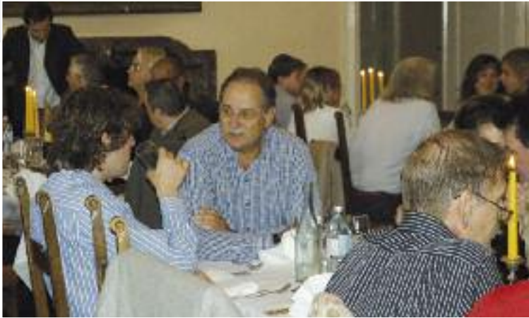
Bis tief in die Nacht nutzen die Eurocab-Teilnehmer die Gelegenheit in gemütlicher Atmosphäre mit ihren Kollegen aus ganz Europa zu fachsimpeln

hören, das aber durchaus ernst zu nehmen ist. In Belgien etwa ist das Taxigewerbe bereits verpflichtet auf den Rechnungen Abfahrts- und Zieladresse anzugeben. Dass alles aber nicht ganz so schnell gehen wird, zeigt das Beispiel Griechenland. „Hier wurde der Fiskaltaxameter zwar schon eingeführt“, berichtete Hale-Geschäftsführer Martin Leitner mit einem Schmunzeln, „allerdings in den Taxis nie aktiviert!“