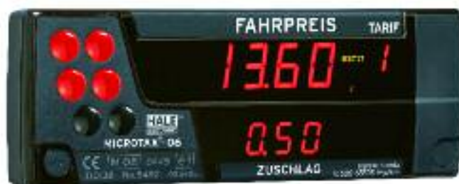
Das österreichische Unternehmen Hale präsentier-te in Köln seinen neuen Taxameter Microtax-06