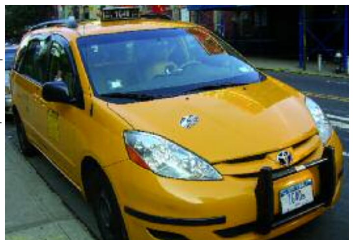
Dieser Toyota Prius ist einer von 1500 Hybrid-Taxis, die in New York bereits im Einsatz sind

abgeschlossen gewesen. Gegen diese Regelung geklagt hatten mehrere Taxi-Unternehmen. Die Betreiber der „Yellow Cabs“ sorgen sich, dass Hybridautos den harten Anforderungen des Dauereinsatzes nicht gewachsen sind. Freiwillig auf den Hybrid-Betrieb umgestellt haben bislang rund 1500 der insgesamt 13237 New Yorker Taxis.