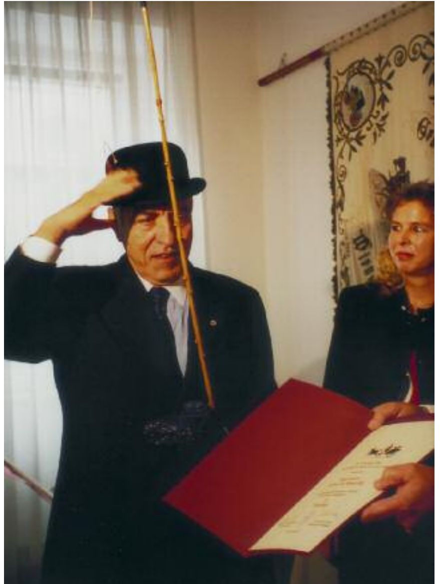
Für seine Verdienste um das Fiaker- und Taxigewerbe erhielt Dr. Helmut Zilk am 17. Oktober 1994 das Ehrenzeichen des Wiener Beförderungsgewerbes

Am Herzen lagen Zilk die Wiener Taxifahrer und besonders die Fiaker, die ja wie der Stephansdom zu Wiens Wahrzeichen zählen. Für ihre Anliegen und Probleme hatte er immer ein offenes Ohr. So sehr er sie unterstützte und gerne als ihr Fürsprecher auftrat, bemängelte er auch ganz schonungslos Mißstände, und forderte deren Abklärung.