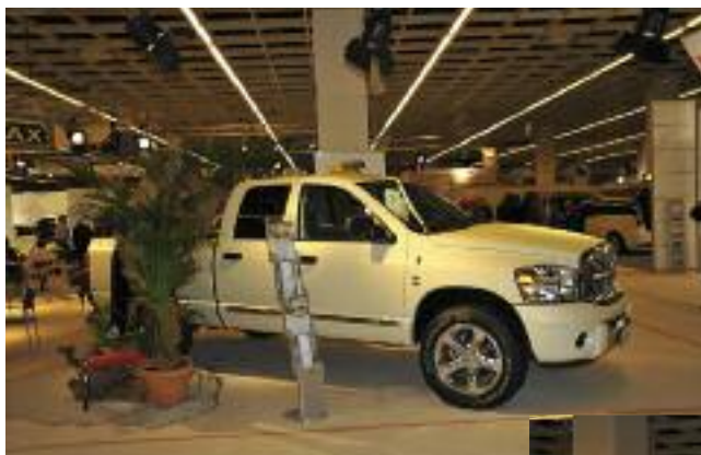
Dieser Pick-Up (li.) als Taxi war ein Werbegag einer Autofolier-Firma. Viele neue Modelle, wie etwa der Insignia von Opel, fanden großes Interesse bei den Besuchern

Die nächste Europäische Taximesse in Köln findet am 5. und 6.11.2010 statt.