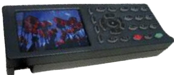
Das neue Bedienterminal DBGE 100NG mit LCD-Farbdisplay der Grazer Firma fms