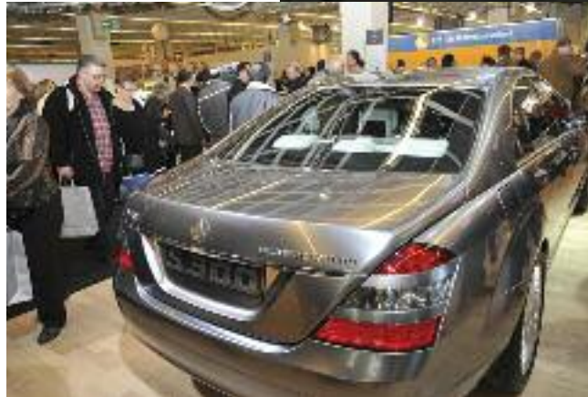
Mercedes zeigte in Köln neben der klassischen Taxi-Modellpalette und der B-Klasse mit Erdgasantrieb auch die Zukunftsmusik einer Hybrid-S 300-Klasse und einer A-Klasse mit Brennstoffzelle